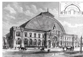
1886年的國家農業展覽廳(後稱奧林匹亞)正門原貌

由於當年收藏紀念章的文化尚未開始, 第一屆世界大露營並無紀念章而只有紀念郵票, 惟其透光展覽廳的圓拱形正門面貌後被廣泛應用為此屆大露營的視覺象徵, 其設計為幾個圖形的對稱組合, 以簡明的線條將複雜的正門入口表達出來, 線條簡潔雋永, 在1920年代, 這是極具現代感的設計。