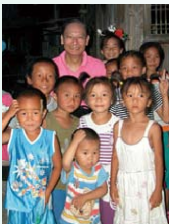
08年7月，與苗族小孩合照於貴州省台江縣苗族農村

此時，香港童軍總會委任我為貝登堡聯誼會會長一職，此乃重大任務，盼望以我當年及今日的童軍手足交情，新朋舊友的友誼，能夠同心協力，助我做好我這一份工。童軍兄弟姊妹們不論你們是否已退出前線，或還正在帶領童軍活動，都可以參加香港童軍貝登堡聯誼會，繼續童軍活動，發揚童軍精神。