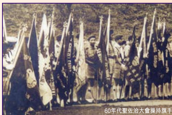
60年代聖佐治大會操持旗手

正因如此，童軍之父貝登堡勳爵在創立了童軍運動後，便揀選了聖佐治作為童軍的主保聖人，除了取其古代騎士守則如時刻準備、保持信譽、永不失約及扶助弱小等以訓勉童軍作為終生格言外，其屠龍故事亦象徵了童軍應有聖佐治一樣的英勇俠義精神，和能絕不妥協地對抗世