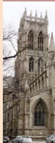
聖佐治大教堂 (網站)