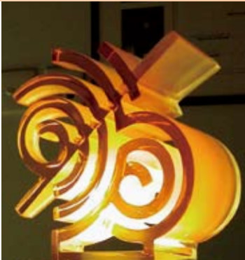
筆者彫塑 - 騎士聖佐治 (2006年)