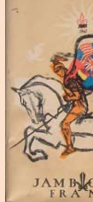
世界大露營文件夾