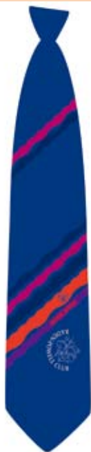
貝登堡聯誼會領帶 (2008年)

最近，應貝登堡聯誼會的委託，設計了一款便服領帶，也是以聖佐治屠龍為基礎。圖案參考自一幅著名聖佐治像，原作以極簡約的線條，描述了複雜的聖佐治屠龍景象，為筆者最欣賞的聖佐治屠龍畫像之一。說到簡約，筆者在06年有一件彫塑創作，取名騎士聖佐治，相信是迄今描述聖佐治馬上英姿的最簡約作品了(見圖)。