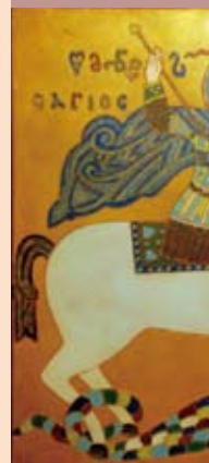
琺瑯壁畫 (俄國藝術)

在價值觀高度歪曲了的今日社會，時刻準備、保持信譽、永不失約及扶助弱小等美德應該再度強調，以抗衡社會上對青少年身心的種種不良影響。