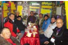
2010年香港童軍百周年大露營童軍知友社攤位

本人有幸能在多個大露營中服務，雖然擔當的工作崗位並不一樣，但角色依然是營職員。本人能在各大露營中完成