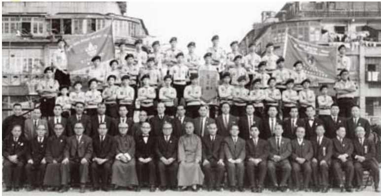
深水埔街坊會九龍童軍第62旅一周年旅慶與街坊首長合照，時為1961年