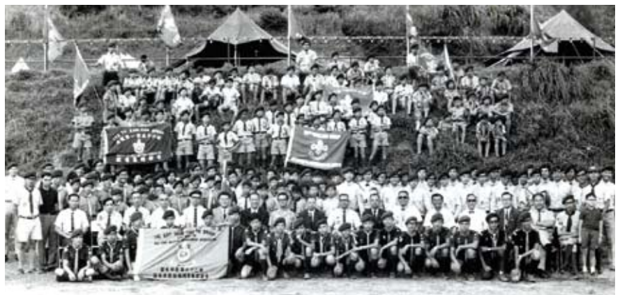
1968年第一屆街坊會童軍旅聯合大露營

時光過去，各街坊福利會和各街坊會童軍旅團雖經歷了各種轉變，包括社會結構，人口遷移，行政更替等，惟仍承諾一如過往，繼續緊守崗位，街坊福利會為社會大眾謀求福利，童軍旅團則以培育未來社會棟樑，有責任感和能隨時幫助他人的青少年為首要任務。