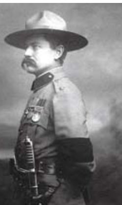
Frederick Russell Burnham

購買闊邊帽可經童軍總會童軍物品供應社向英國童軍總會購買，而本港也有地方售賣國內的製品，亦可自行從網上向外國童軍會訂購，甚至從拍賣網站投拍國際市場上更具價值和有歷史意義的童軍舊物，但須留意的是，除了認清所購帽子的凹位方向外，帽的大小尺寸必須小心核實，以免收到時不合戴致物無所用又佔據地方，此外，闊邊帽筆挺狀態需要小心保持，因在例如香港這類較溫暖潮濕的地方帽子很易彎曲變形，建議不用時使用帽夾 (Campaign Hat Press) 夾好，帽夾可自行製造或同樣從網上訂購。