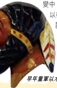
早年童軍以木頭彫刻的印第安人頭領巾圍

童軍運動在與時並進，今日的青少年較以前不喜歡被束縛，因此源自軍旅規格，崇尚整齊劃一的原始童軍制服規格至今在悄悄的改變中，相信上述較為隨意的領巾和巾圍佩戴方式在世界各地在以後會愈來愈多。至於領巾款式和質料亦有了很大的變化，以款式來說，由於印製技術的進步，領巾設計愈來愈繽紛，領巾在佩戴後前後看都花枝招展了很多。至於巾圍的形態和用料，在現今成員眾多加上高科技之助，早已是大量生產且花款層出不窮，和當年自己以木頭彫刻，或用繩結編織一個充滿個性巾圍的那個年代，那種情懷，早已不能比較了。