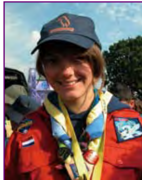
充滿嘉年華氣氛的隨意領巾 佩戴方式

領巾，敞開的領口也使人有較輕鬆的感覺，近數十年，以此法佩戴領巾的國家越來越多，在亞熱帶地區的童軍尤其盛行，並且包括了北美洲最多成員的美國。只是論整齊便不及英聯邦童軍了。