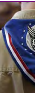
領巾佩戴在制服使人有較輕鬆的