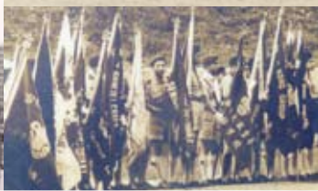
聖佐治日會操的旗手區

不算遠；旅長安排旗隊持旗領隊，帶領其他團員排成行列步操前往木球會。第一年從軒尼詩道出發，第二年改從高士打道出發（當年還未填海，只有南面灣仔警署的一邊，另一邊北面已是海傍，那時貪圖高士打道沒有太多行人，步操起來特別醒神）。後來，會操改在九龍槍會球場舉行，我們由灣仔乘小輪渡海，然後從紅磡碼頭步操前往。後來因為街道行人眾多加上有地鐵接駁到會場附近或有專車抵達，近年已很少旅團步操前往會場了。