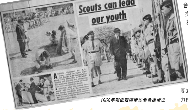
1968年報紙報導聖佐治會操情況