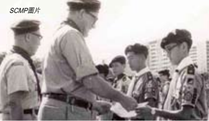
1966年總領袖戴麟趾爵士頒發榮譽童軍證書予朱健中