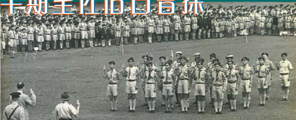
1961年榮譽童軍列隊領取榮譽童軍證書