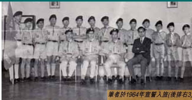
筆者於1964年宣誓入隊(後排右3)

有時總不免懷緬過去，感嘆時光飛逝，想起陳年舊事容易隨時日消失，不若記錄下來，留給大家和自己一個回憶。