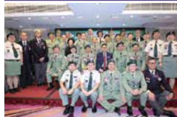
2018-19年度會務委員會就職典禮暨會員周年聚餐 18年11月2日