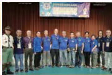
童軍知友社金禧紀念度假營 18年12月26日