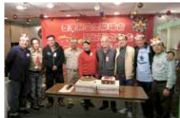
會員聖誕聯歡聚餐 18年12月16日