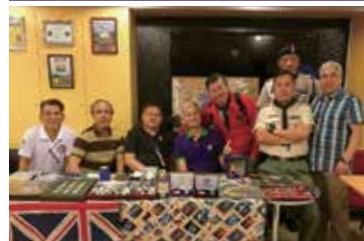
童軍紀念章交換及銷售日 18年10月20日