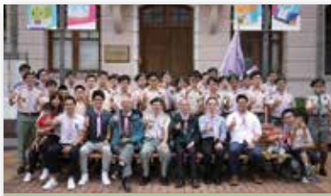
今日的港島第五旅

我在戰時失學，1946年戰後初期，家父曾安排我到廣州，寄居姨媽家，就讀市立33小學，童軍訓練是必修科。所以對童軍運動略知一二。一年後，他又召我回港，入讀聖類斯學校，兩年後又轉入荷李活道官立英漢文學校讀第八班(即後期的荷李活道官小學五年級)，1950年升入英皇中學附屬學校第六班(即後期中一)。及後改用新制，中一至中五，中六和中七是大學預科班，後因家道中落我要輟學幫補家計，但沒有放棄童軍活動。