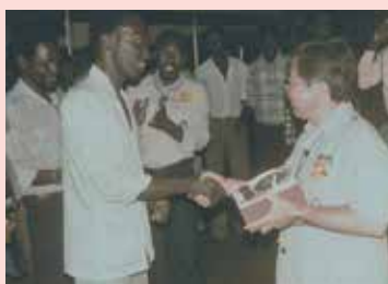
將香港紀念品交當地代表

出關一望，巨窿也，趨前急問，大劫餘生，其無恙乎？幾乎：大灑中華熱淚於化外，援救落難同胞出生天！