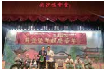
貝登堡粵韻慶華年 18年11月25日