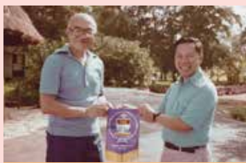
領隊施克然將香港紀念旗交中華人民共和國駐塞內加爾大使