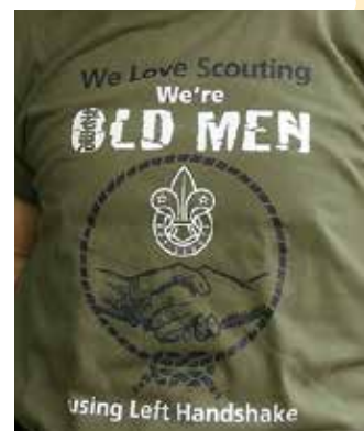
以左手握手禮作為設計意念的「我愛童軍運動」老鬼T恤

不計算過往百年，單是現在全球就有約三千萬人使用左手「童軍式握手」和同伴打招呼，想表達的和以往百年童軍史中接近四億名曾為童軍人仕一樣，就是：「你好！我信任你！」和「我們是兄弟/姊妹！」的世界大同思想。