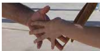
以拇指互扣的美式左手握手禮

除了正常的握手方式，即大家手掌互握而以拇指扣著外，左手握手曾有一個特別的演變，就是大家的尾指也和食中無名三指分開，與對方互扣，這樣的握手方式使握手更為緊密，據說更為交心。此握手法由美國童軍開始，美國童軍於1908年創立至1910年採用BP的原左手握手方式，至1911年取消左手握手改用正常社交的右手握手，由1912始，他們更以右手用尾指又開的獨特握手法，就和右手敬禮一樣，他們把敬禮時豎起的三隻手指指向對方手心，而以拇指和尾指互扣，這樣的敬禮方法他們認為和童軍三指敬禮一脈相承，拇尾指互扣也更為親熱。至1927年，可能在1926年在第四屆世界童軍會議和各國領袖有了共識，美國童軍改回貝氏指定的用左手握手，但保持拇指外尾指也互扣的獨特方式，這方式至1971年美國仍在用。由於美國的影響，當時其童軍屬國菲律賓也使用這個握手方法，並影響了其他亞太區國家包括香港在內，都有人用這種方式握手，惟美國於1972年開始已取消了這個拇尾指互扣的握手方式，改回和全球一樣的正常左手握手法，有說是因為女性成員愈來愈多，這三指伸往對方手心，而以拇指和尾指緊密互扣的握手方式過於親密，並不適合初認識的人。實情是否如此也難以證實，但其實到今天，很多懷舊的人仍然用這拇尾指互扣的方式和舊友互握，以表示他們在童軍運動服役良久，經驗豐富。