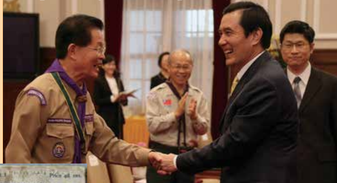
台灣前總統馬英九先生以童軍握手禮與亞太區童軍領導人握手

白浪島實驗露營之後，貝登堡勳爵將露營期間每天晚上在營火會和小孩們談話的內容和他的訓練兒童理論，編輯成「少年警探」(Scouting for Boys) 手冊，於1908年1月15日開始發行，共有六本，每兩星期出版一本，在出版於1月15日的第一冊，由第40頁至第42頁的「Scout's Salute and Secret Sign」(童軍敬禮與記號)一篇中，述說了童軍的各式敬禮和記號，其中有關於握手，他寫道：「If a stranger makes the scout's sign to you, you should acknowledge it at once by making the sign back to him, and then shake hands with the LEFT HAND...」(當一個陌生人向你舉起童軍手號，你應以童軍手號回應，之後與他用左手握手...)。