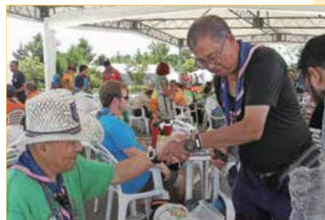
在公開場合，左手握手禮標示了「我們是兄弟！」

至於其他的版本，包括有人認為貝登堡要求童軍用左手握手是因為可以和右手的敬禮同時進行；也有人認為在童軍運動創立的初期，在世界上很多地方尤其是較為落後的地區，例如貝氏曾駐紮多年的南非，有很多人是用右手做較骯髒的事情，而以左手進食，因此左手較右手清潔，較能代表清純的友誼；此外，也有說法是左手較右手接近心臟，用左手握手較為真誠等。這些原因都可能是貝登堡選擇童軍用左手握手的原因之一，但事實上貝氏有否真正同時考慮過這些因素，實在也無從稽考了。