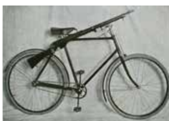
弗萊徹·貝登堡發明的可以摺疊的軍用腳踏車

弗萊徹·貝登堡是首位把航空的理念帶給童軍活動，起初只是用風箏和模型飛機，還沒有考慮到空童軍這一方面，直到第一次世界