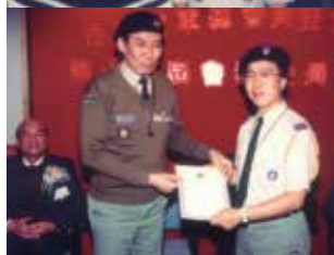
上 - 攝於2017/2018年度會務委員會就職典禮 中 - 攝於1990年童軍知友社 下 - 攝於1995年被委任為香港童軍貝登堡聯誼會助理總監