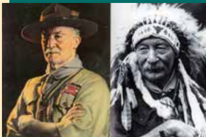
Robert Stephenson Smyth Baden Powell 羅拔·史蒂芬生· 貝登堡勳爵 (1857-1941)