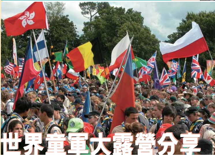
2007年第21屆世界童軍大露營開幕禮