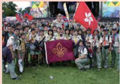
第21屆世界童軍大露營東九龍地域代表

展望未來，前人的寶貴經驗值得大家好好珍惜，我樂於見到我們有更多的成員能以不同角色參與世界性或地區性的大露營，享受樂趣，服務他人，擴闊視野，充實自己，並建立團隊精神及結下國際童軍情誼，將這項有意義的童軍活動和露營生活傳承下去。