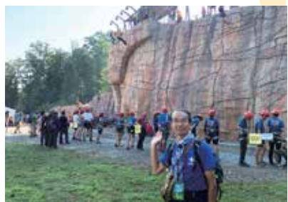
第24屆世界童軍大露營巨大的攀石牆

叢林非常吸引的「高空滑索」，另外亦有十分刺激的激流旅程、潛水、攀石牆、滑板公園、射擊等項目。因熱水供應不足，營友們每晚也要享受攝氏12度的冷水浴；同時於營區出入時也要小心翼翼避開隨時出沒既可怕也可愛的巨大動物 - 熊！