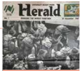
第16屆世界童軍大露營營地日報

營期內的海童軍海上巡遊，有超過200艘來自40個國家的艇隻參加，是歷屆大露營最大規模的相關項目。大會更設立「友誼獎章」以促進全球各地童軍的友誼；而香港代表團的「筷子管理技術課程」和「中文譯名服務」甚得各地營友