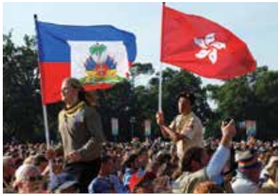
第21屆世界童軍大露營開幕禮香港持旗手入場