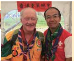
筆者與貝登堡勳爵孫兒Michael Baden-Powell攝於第23屆世界童軍大露營