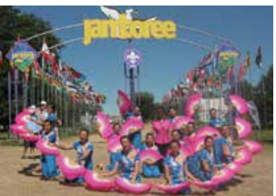
第21屆世界童軍大露營香港代表團羽扇舞表演隊