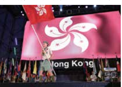
第23屆世界童軍大露營開幕禮香港持旗手入場

領袖及青少年成員在8月8日回程香港期間，因突然有超強颱風吹襲，致使航班非常短缺，他們分別被迫在日本及台灣兩地機場滯留三日，幸好大家處變不驚，各帶隊領袖均臨危不亂，而我們的青少年成員更表現超卓，嚴守