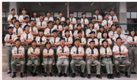
1999年執行幹事研習班

在事業上，他是一位出色的警務人員，他是當年以最短年資，由督察升級至警司的極少數華籍警官之一。他曾多次獲派往海外受訓和工作。