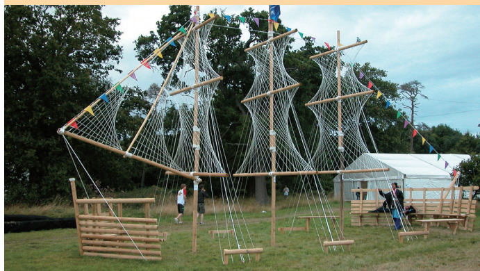
以上營門由溫哥華海龍海童軍旅提供及攝自各屆世界大露營