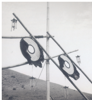
1967年首屆全港小隊長大露營新界地域營門

營門設計也可反映某一段時間的社會焦點或盛事，例如為建國若干年慶祝舉辦的全國大露營，營門的設計自然和建國歷史或年份有所關連。而各屆世界大露營的主題，也成為很多參加代表團營門的主要題材。我試舉一例子作說明，1967年有一部台灣武俠電影《龍門客棧》在港上映，票房大紅，很多人都看過，那年全港街坊會童軍大露營於飛鵝山基維爾營地舉行，我負責的本旅營門就以一個在邊關大漠的客棧寨門為構想，造型獨特，別樹一幟，成為營地最受歡迎的拍照景點。