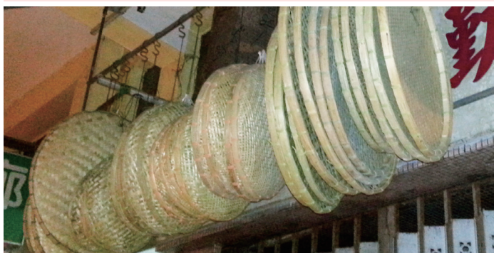
山貨店出售的竹蓆、竹帽、藤牌、竹篩、麻布袋等，提供了營門設計的很多可能性

打印橫幅極不環保，露營後便成廢物不能重用，再者打印橫幅構圖流於公式化，除非有好設計師主理，否則都是千遍一律只有文字不同的露營公仔卡通橫幅，這和以前人手繪製的粗糙但具野性營門實不能相提並論，但由於其方便攜帶和收藏，以及準備時間大幅減少，取代傳統手造營門的圖案文字處理也似乎是大勢所趨了，這情況在大城市的童軍活動尤其明顯。