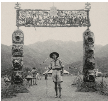
1949年九龍童軍二次大露營總營門