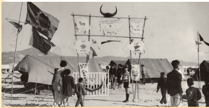
1961年金禧大露營，九龍六十二旅營門

由於童軍創辦人貝登堡勳爵的軍人背景，他創辦的童軍運動中大部分制度都有濃厚的軍人色彩，童軍都有接受類似軍人般的基本訓練，例如步操和制服，而露營的營地也基本上接近行軍的軍旅駐營方式，而營區中的營門建設，更比軍旅營門更為發揚光大。由於童軍露營基本上以歡樂為主，與軍旅駐紮的性質不同，所以童軍營門是更為多姿多采和創意繽紛。在一個世紀的時間內，童軍營門由簡入繁，由靜到動，多番輪替，至今成為一種獨特的童軍美學文化，使到露營營地生色不少，也成為不少人欲留下美好回憶的最佳背景。一張站在營門前的照片，溫暖了多少人的心靈，勾起了多少的美好回憶？