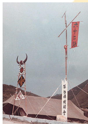
《龍門客棧》意念營門

營門設計也可反映某一段時間的社會焦點或盛事，例如為建國若干年慶祝舉辦的全國大露營，營門的設計自然和建國歷史或年份有所關連。而各屆世界大露營的主題，也成為很多參加代表團營門的主要題材。我試舉一例子作說明，1967年有一部台灣武俠電影《龍門客棧》在港上映，票房大紅，很多人都看過，那年全港街坊會童軍大露營於飛鵝山基維爾營地舉行，我負責的本旅營門就以一個在邊關大漠的客棧寨門為構想，造型獨特，別樹一幟，成為營地最受歡迎的拍照景點。