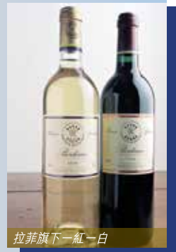
拉菲旗下一紅一白

拉菲酒的主要成份是赤霞珠(Cabernet Sauvignon)葡萄，因年份不同，約佔八成至九成半，其他則是小維鐸及加本納芳，用全新的橡木桶儲藏十八個月至二十個月才入瓶。再在酒窖陳放三年左右，清洗再貼上標籤出售。年產量大概是萬五至二萬五瓶之間。據說國內銷量約十萬瓶，其真假大概可以想像得到。至於副酒，年產量約十萬瓶，雖然用生長欠完美的葡萄來生產，但產量卻甚多，有窮人的拉菲之稱號。