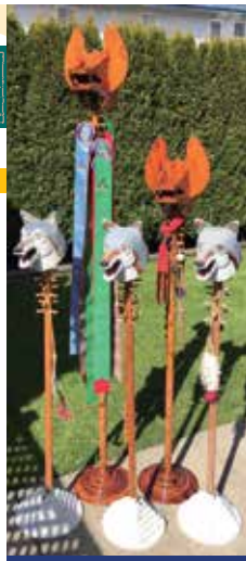
不同時期的狼頭圖騰棒

早期的小狼團都有權攜帶一枝狼頭圖騰棒(Totem Pole)，是小狼團的精神象徵及標誌，初期的狼頭是用木材雕刻而成，後有用橡膠所製，本來的狼頭圖騰棒是一個像真的狼頭安裝在一枝木棍上，最具象徵意義，但因有時引起了小孩的害怕，故後來有人設計了抽象版的狼頭，以木塊嵌成，此抽象版狼頭圖騰棒不但消除了嚇人的狼頭外觀，也增加了小孩喜愛的卡通元素，而且以簡單的工具便可自己製造。資深的小狼團圖騰棒有如一枝酋長權杖，棒身刻有童軍專有的象形文字、圖案、名號、以至記錄事項，有些更會在狼頭下掛有二至二吋半闊的彩帶，是大型活動或比賽所得的榮耀紀錄，狼頭棒在每次集會由值日小隊長在開會及散會儀式中或作狼呼時手持專用。1918年的POR曾指出，只有已參加小狼超過一年，並已獲得二級星章的小狼才可手持狼頭圖騰棒。