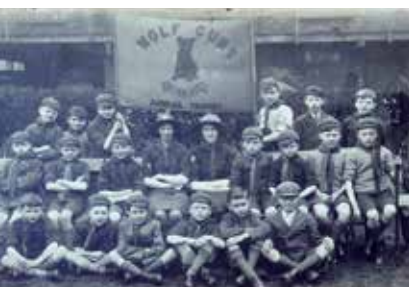
早年的小狼團合照可見當時的小狼團旗和狼頭圖騰棒

早期的小狼團旗以一隻蹲坐在地上的小狼為圖案，小狼下有綑帶上書“DO YOUR BEST”，小狼的上方有圓拱型“WOLF CUBS”字樣，下方則有橫向平排的團主辦機構名稱，小狼團旗一般為黃色，字為綠色而小狼圖案多為棕色，很多早期的小狼團旗都是手繪的，因此統一性並不太高。