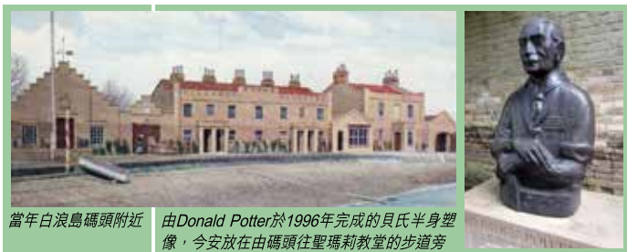
當年白浪島碼頭附近

首先面對的問題，在哪裡？露營的地方不能過於荒蕪遠離人煙，因為他計劃邀請的參加者是小孩子，必須在緊急時容易回到文明世界，但也不能太現代化，因他一直以為，真正的野外才能訓練孩子並引發孩子的潛力，他一直未能解決地點的問題，直至1907年的5月，貝氏在愛爾蘭旅行期間認識了查爾斯·溫立德 (Charles van Raalte) 夫婦二人，貝氏對這位新朋友提及他的計劃，查爾斯立刻想到他在英國南岸Poole港外的白浪島 (Brownsea Island) 上的鄉間別墅，他向貝氏介紹該島的風光和地形，並邀請貝氏到島上探訪他們。