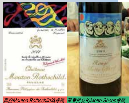
真的Mouton Rothschild酒標籤 筆者所見的Motte Sheep標籤

根據國內的法例，此酒完全不假，所有的資料都齊全，只是不是你腦海中那品牌的真品，這類酒，祇能說一句願者上鈞而已。皆因此酒一支祇賣128元，一對則祇售200元，兼送一個酒箱，如此價格，當然自行研究了。