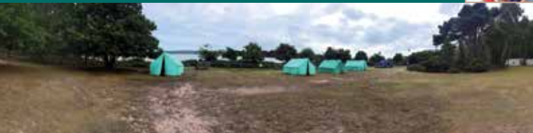
白浪島實驗露營原營地今天

島上基本上保留了110年前實驗露營時的形態，得益於受到保育，島上不容許任何發展，使其和普爾港一帶臨海地段的蓬勃住宅發展不一樣，在島上，基本上大部分地方都杳無人煙，最多的只是悠閒踱步的孔雀和視你如無物的松鼠，當然有訪客時例外，訪客中又來自世界各地到來朝聖的童軍最多，甚至很多童軍在這裡的幾個營地露營，當然，1907年實驗露營的原營地是最受歡迎的。