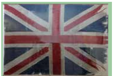
這面破舊的英國旗，在梅富根城使用過，也在白浪島實驗露營營地每日迎風飄揚，今懸掛在基維爾營地白宮內的走廊

日換星移，轉眼百年，2017年的8月1日，是白浪島實驗露營的110周年，英國童軍總會這天在島上舉行升旗紀念儀式，香港童軍總會九龍地域組織了代表團到島上參與這歷史性的儀式，並順道遊覽這個在童軍運動中最重要的聖地。我在這個活動中為他們設計了代表團標誌、紀念章和紀念領巾，更跟隨大隊到島上參與盛事。