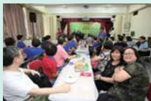
好歌獻給你—歌唱比賽

在本年度，承蒙會長、主席及總監的支持與認同，我在香港童軍貝登堡聯誼會被調回公共關係小組任主席，回頭重操故業，我雖感十分戰兢但也十分興奮，期望未來的工作不負大家所望。展望將來，會竭力繼續推行各項份內工作，也會採用切實的預算模式，在不浪費資源的大原則下完成任命，以實行我的童軍服務精神，和配合童軍總會的管治理念。