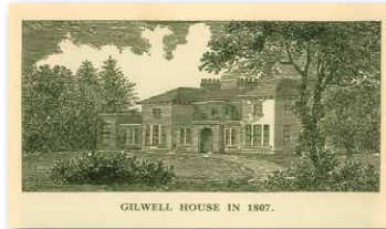
GILWELL HOUSE IN 1807.