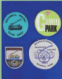
基維爾公園黃金年代的部份