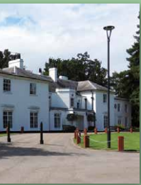
公園聖視為訪英重要項目，訪公園於正門拍照留念