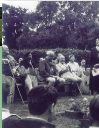
洪昭安前輩在1966年參加的影片可見貝登堡勳爵的太太與