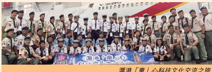
滬港「童」心科技文化交流之旅