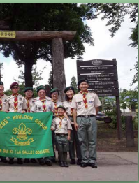
公園聖視為訪英重要項目，訪公園於正門拍照留念