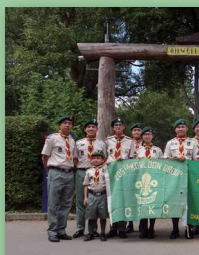
世界各地童軍到訪基維爾公以上為九龍205旅於今夏造