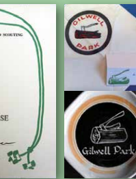
的部份證書和紀念品