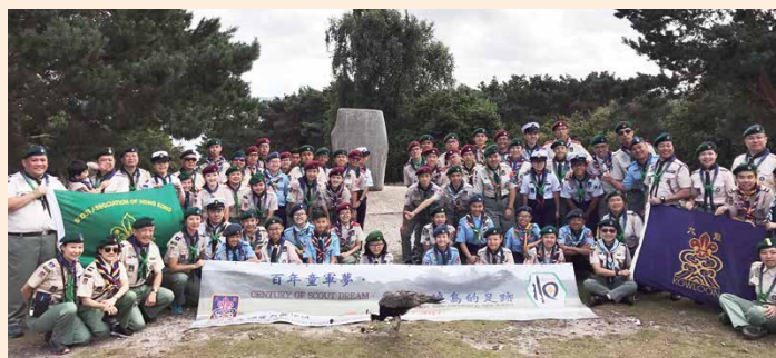
白浪島實驗露營110年紀念升旗儀式香港代表團

繼往開來，我會繼續帶著服務九龍地域和總會的熱誠，繼續秉承聯誼會一貫的宗旨，透過舉辦更多不同種類的課程和活動，無論是動是靜，是圍繞不同會員感興趣的主題，包括健康資訊、生活品味、娛樂、旅遊、藝術等，讓會員能加強彼此的聯繫；此外，我們亦期望透過不同的宣傳渠道，吸納更多現役或退役的童軍人士參與聯誼會活動。聯誼會亦會繼續組織不同的活動，讓有心有力，有知識有經驗及有技能的童軍人士，在閒遐時服務社群，和在生活中繼續實踐童軍誓詞和規律，發揚童軍助人的精神。