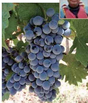
馬瑟蘭葡萄(網上圖片)

早前在一個品酒會，有幸見到一支由寧夏長和翡翠酒莊出品的馬瑟蘭干紅，用法國橡木桶釀陳六個月，瓶儲六個月，酒精度14.5%，酒體深紫，櫻桃、煙熏、香草和咖啡味，單寧足，容易入喉，希望未來就有機會把此酒莊產品介紹給大家。