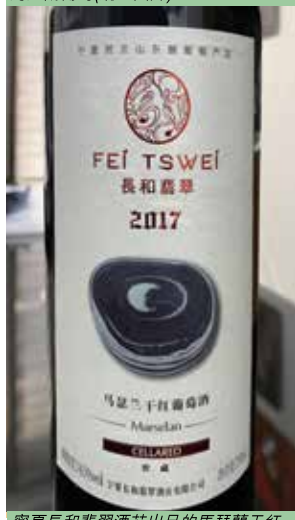
寧夏長和翡翠酒莊出品的馬瑟蘭干紅