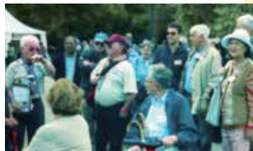
2007年的金禧大露營50周年重聚在基維爾園

拍照後遊覽基維爾園，聽工作人員講述基維爾園起名來源及歷代園主的故事，包括Gilwell鬼故（沒有哪所英國古老大屋無鬼故）。我感興趣的不是鬼故，而是 White House 後的鐵欄河。這是從拍賣行購來多年前拆卸的18世紀 London Bridge 一小段。我向一位英國童軍領袖問：「為甚麼不多介紹有關童軍領袖訓練的歷史和人物，例如約翰·科文？」他笑著回答：我知道外國童軍領袖很尊崇約翰·科文，但他的領袖訓練政策引起爭論，他晚年被調離訓練主任的職位，不大快樂。