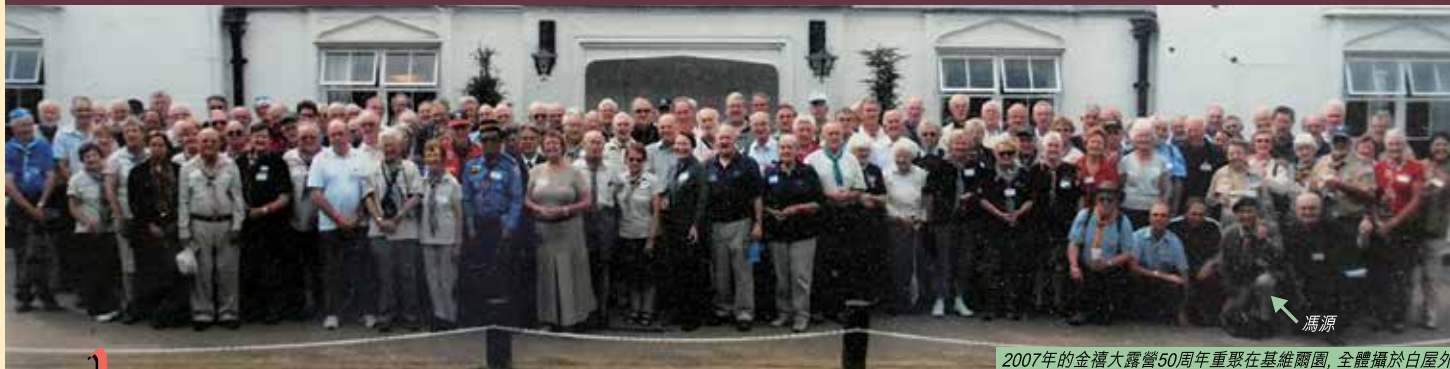
2007年的金禧大露營50周年重聚在基維爾園，全體攝於白屋外

1957年世界大露營(Jubilee Jamboree)在英國伯明翰市塞頓高爾非特公園舉行，正值童軍運動創立50周年，冠以金禧之名。2007年，營友在英國劍橋大學羅拔臣堂重聚，雙金禧之慶，實屬難得。