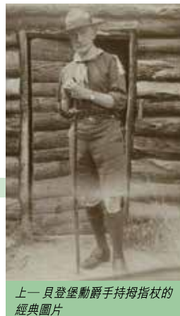
上一頁登堡勳爵手持拇指杖的經典圖片