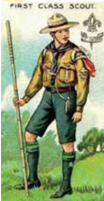
上一頁早期的童軍形象插畫中，童軍大多手持童軍棍