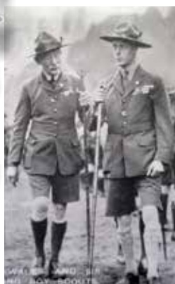
上一頁登堡勳爵和威爾斯太子手持拇指杖檢閱童軍

拇指杖是世界童軍運動組織擬定的羅浮童軍的標誌，羅浮也稱樂行，是童軍各支部中年紀最長的支部。最早出現於1918年，成員為18歲以上的青少年，他們的隨身棍棒便是一支拇指杖，拇指杖的造型必須是頂端有對稱的Y型樹榫，它在童軍活動中也有很大的用途，例如在多雨的季節行山休息時可以把杖依靠樹幹或山崖旁，就可以把背囊懸掛在Y型樹榫處以免觸及潮濕的地面，也可在徒步山野遠足中作為增加支持身體在崎嶇的山路提供穩定性的輔助工具，以至探測地面泥沼及積水的深度等。在歐洲北美等地，由於羅浮童軍已是成人，一般都自己製造拇指杖，在野外尋找長度符合自己手握舒適，一般約為