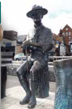
上一英國普爾港前往白浪島的碼頭上，有貝登堡勳爵手持領袖杖的雕塑