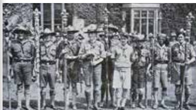
上一1929年的世界大露營唐納·波德雕刻的五根送給英聯邦自治地方代表的圖騰杖

又可稱權杖(Sceptre)，是一般用於儀式的大型手杖，權杖自古已有，由部落酋長以至帝王，均有手持權杖以增加威嚴的做法，這些權杖在權力更替時會交給接任人以象徵權力的轉移承接。圖騰杖算是最大型的童軍棍棒，可以高逾8呎，一般雕上各式圖案，最著名的有貝登堡勳爵的門生唐納·波德(Donald Steele Potter) 在1929年為出席第三屆世界大露營的英聯邦自治地方代表包括澳洲、加拿大、紐西蘭、南非和印度等的代表在出席開幕禮時手持的圖騰杖，該杖以童軍徽刻在頂端，